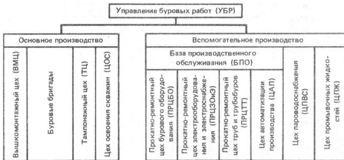
Рис. 1. Производственная структура бурового предприятия